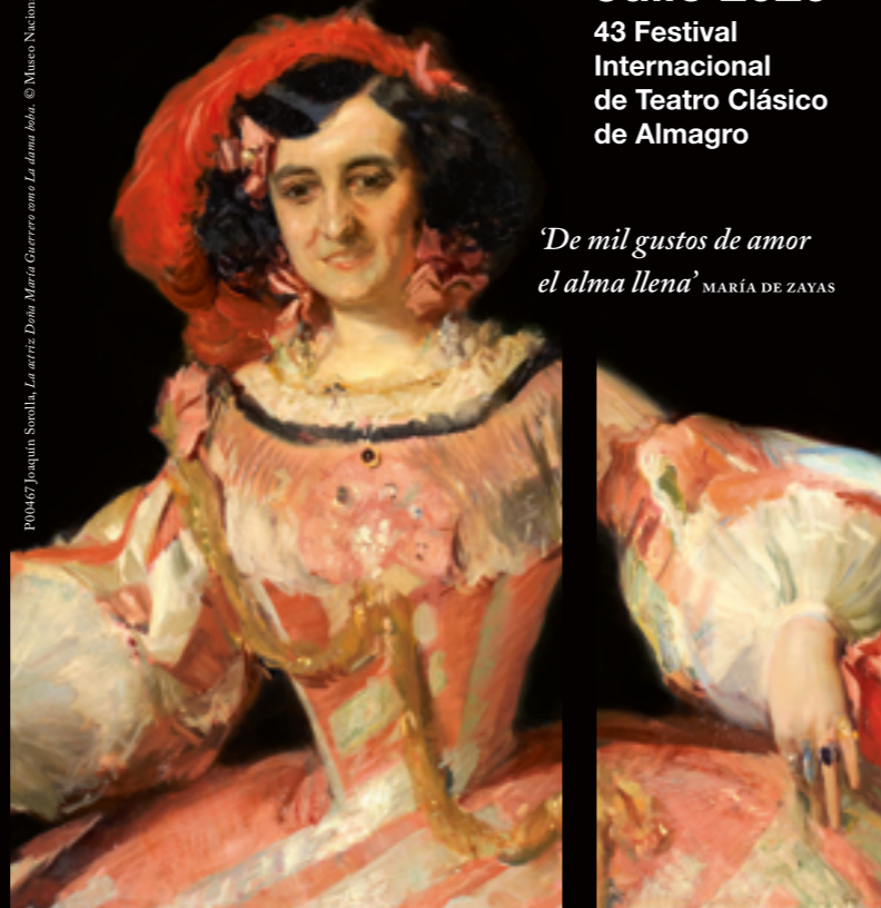
De mil gustos de amor el alma llena MARÍA DE ZAYAS

43 Festival Internacional de Teatro Clásico de Almagro